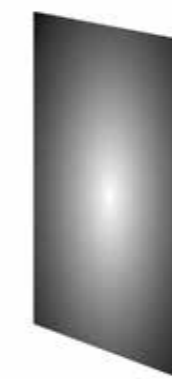
Acciaio scuro Dark Steel Acier Foncé Stahl Dunkel Acero Oscuro Сталь Темная

Anta acciaio scuro . Door Dark Steel . Porte Acier Foncé . Front Stahl Dunkel . Puerta . Acero Oscuro . Створки Сталь Темная