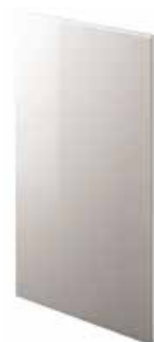
Laccato lucido Glossy lacquered Laqué brillant Hochglanz lackiert Lacado brillo Лакированная гляцевая

Spessore anta 2.2 cm . Door thickness 2.2 cm . Épaisseur porte 2,2 cm . Frontstärke 2,2 cm . Espesor puerta 2,2 cm . Толщина створки 2,2 cm