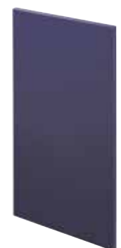
Laccato opaco Matt lacquered Laqué mat Matt lackiert Lacado mate Лакированный матовая