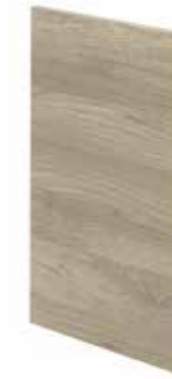
Opaca con bordo ABS Matt with ABS edging Mat avec chant ABS Matt mit ABS-kante Mate con canto ABS Матовая с кромкой из ABS-пластика

Spessore anta 2,2 cm . Door thickness 2.2 cm . Épaisseur porte 2,2 cm . Frontstärke 2,2 cm . Espesor puerta 2,2 cm . Толщина створки 2,2 cm